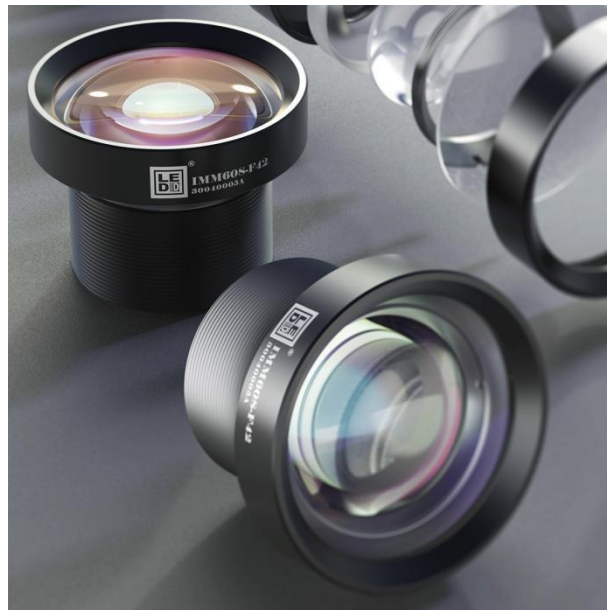
图 1: IMM60S-F42

应用：高清投影灯、图案灯、切割灯以及高清广角投影仪等对成像清晰度和畸变控制要求高的设备。